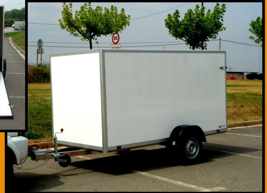
Remolque ligero categoria O1